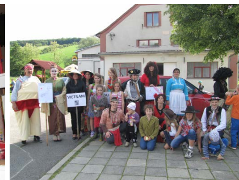
Cesta kolem světa