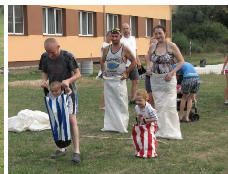
Sportuje celá rodina