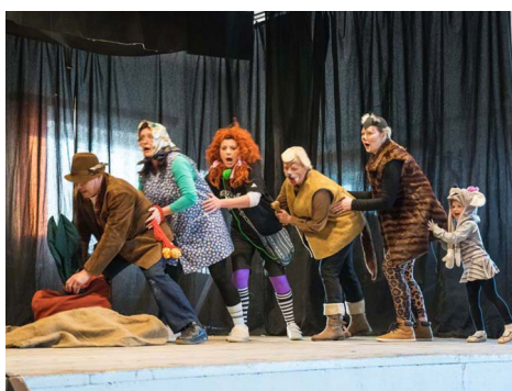
Pohádka „O veliké řepě“