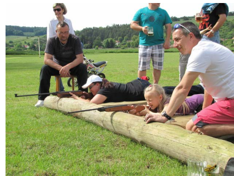
Hurá za sportem