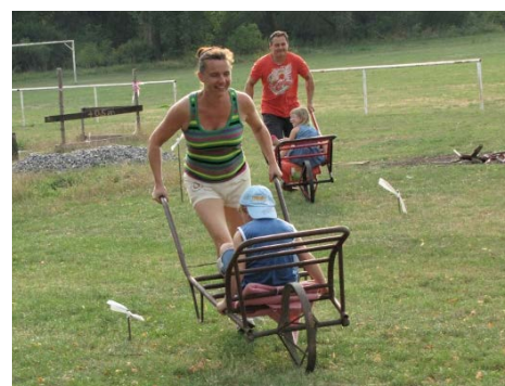
Sportuje celá rodina